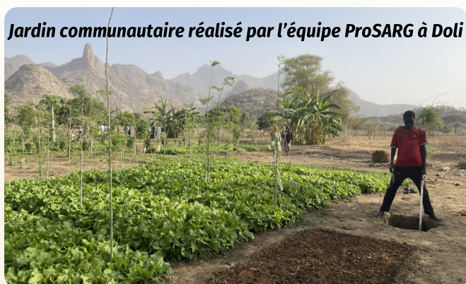
Jardin communautaire réalisé par l'équipe ProSARG à Doli

Le projet ProSARG montre des résultats vraiment impressionnants. Sur le terrain, les changements sont profonds : les familles passent de situations précaires à des activités qui rapportent, les communautés deviennent plus solidaires et les sols, autrefois épuisés ou détériorés par les intrants chimiques, redeviennent productifs. Ces dernières années, les agriculteur-rice-s devaient parfois cultiver des champs situés à plus de 20 km de leur village pour trouver des terres encore fertiles. Aujourd'hui, grâce à la méthode du Zaï, ils peuvent régénérer les champs proches de chez eux et les remettre en culture. Ceux qui réussissent avec cette technique changent aussi souvent de statut et deviennent des personnes importantes et écoutées au sein du village. Un signe qui ne trompe pas : la disparition des périodes de soudure 1 , preuve que la sécurité alimentaire s'améliore concrètement. Mais tout n'est pas parfait. Le succès du projet fait aussi apparaître des tensions, notamment autour des terres restaurées ou entre agriculteurs et éleveurs, preuve que tout cela se joue dans un contexte fragile.